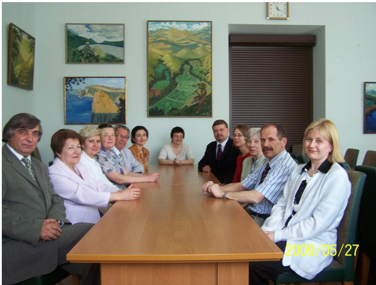
Кафедра теорії літератури, компаративістики і літературної творчості

Друкованим органом Школи є збірник наукових праць "Філологічні семінари". Підготовлено до видання й опубліковано 15 випусків цього збірника (1998 – 2012). Підсумкові досягнення Школи висвітлено у праці М.Наєнка "Філологічний семінар: школа наших традицій" (2012) . Крім того, опубліковано в Україні і за рубежом багато статей, доповідей, рецензій, котрі писалися або виголошувалися у зв'язку з діяльністю Школи чи для проведення щорічних симпозіумів учасників "Філологічного семінару".